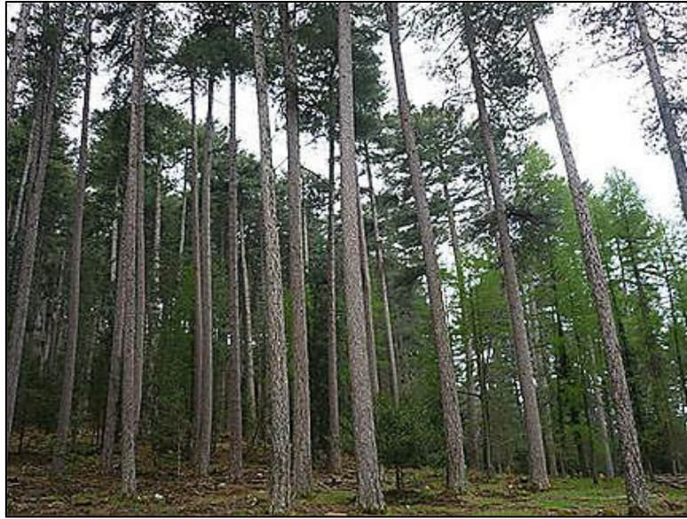
U larice, ricercatu assai pè i battelli.

In u 1804, u gruppu di dipurtatu antiglianu hè statu sminuitu à magre persone dà u decretu, l'evazione è e liberazione ch'ùn anu nisunu documentu ch'ì u signaleghja , ma ch'ì anu pussutu esiste, dopu nove anni di travagli furzati . Eppure , i travagli di cunstruzione di e strade, destinati per u piu a ghjunghje versu a costa , ma i maghji di i betteli stratti di e fureste di Vizzavona è Aitone , cuntinueghjanu. U ministru decretu ligà una tamenta impurtenza à l'affacata di i legni corsi ind'i cantieri di cunstruzione di Tulò . L'aiciani è i Guadelupeani n'ùn sò oramai più i soli nant'à i cantieri : Cuntemu squadre d'operai liberi, forze suldadi , in più di i galieriani , induve u u numeru di Napolitani avà. Cusì, di a furesta d'aitone sinn'à u purtu di Sagone , l'operai liberi anu cunstruitu in 1811 guasi cinque kilometri di strade, è i galieriani Napolitani più di sei kilometri. L' « omi di culore » sò, mi pare più numerosi in Vizzavona, s'hè no ghjudicemu dà i risultati notati dà u decretu di u 30 di dicembre di u 1811 : « ... »