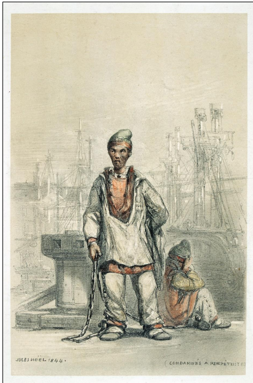
Jules Noël, Bagnards du bague de Brest condamnés à perpétuité , Crayon, 1844, Musée des Beaux-Arts de Brest.