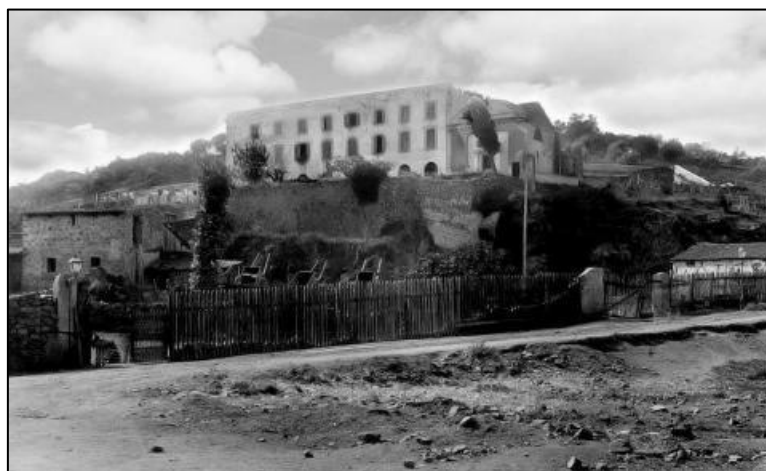
U conventu di i capucini d'Aiacciu, ritrattu di u 1900

Dà u 11 di dicembre di u 1802, u prefettu maritimu di Tulò si preoccupghja di u locu d'acogliu di i dipurtati in Aiacciu. Serà a ghjesa di i capucini chì serà scelta.