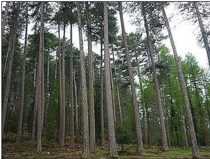
Le pin Laricciu, prisé pour les mâts des navires.

En 1804, le groupe des déportés antillais est réduit à de maigres effectifs par les décès, les évasions et les libérations qu'aucun document ne signale, mais qui ont dû exister, après neuf ans de travail forcé. Cependant, les travaux de construction des routes, destinées notamment à amener vers la côte, les mâts de navire extraits des forêts de Vizzavona et Aitone, se poursuivent. Le ministre Decrès attache une telle importance à l'arrivée des bois corses aux chantiers de construction de Toulon. Les Haïtiens et les guadeloupéens ne sont désormais plus seuls sur ce chantier : on compte des équipes d'ouvriers libres, voire de soldats, en plus des forçats, dont nombre de Napolitains dorénavant. Ainsi, de la forêt d'Aitone au port de Sagone, les ouvriers libres ont construit en 1811 près de cinq kilomètres de route, et les forçats napolitains plus de six kilomètres. Les « hommes de couleur » sont, semble-t-il, plus nombreux à Vizzavona, si l'on en juge par les résultats notés par Decrès le 30 décembre 1811